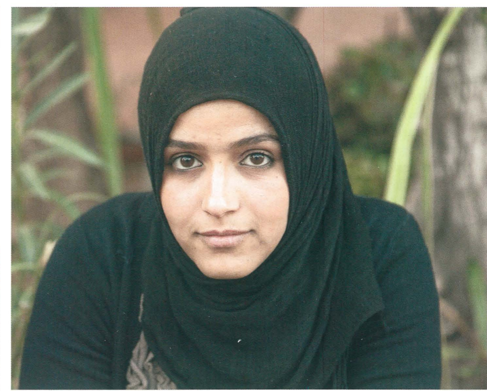
(Soldan sağa sırayla) Fotoğrafçının Lourdes, İstanbul ve Marakeş projelerinden portreler. Onların adı yok, onlar 53, 191 ve 107 numara.