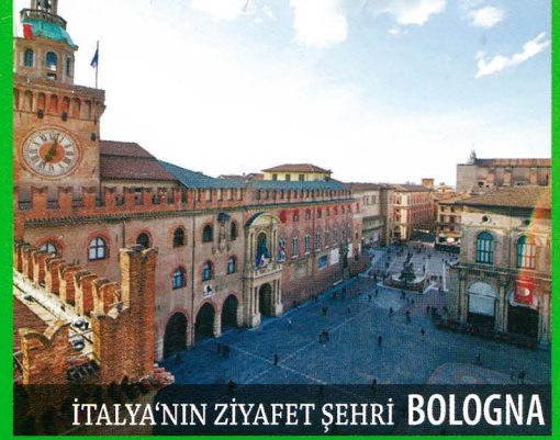
İTALYA'NIN ZİYAFET ŞEHİRİ BOLOGNA

BAKIŞ AÇINI DEĞİŞTİRİRSEN DÜNYAN DEĞİŞİR